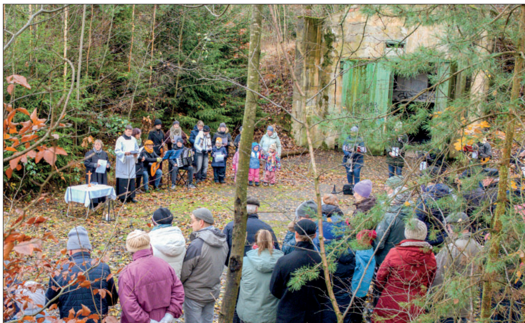
Katolscy a ewangelscy wěriwi modlachu so zhromadnje před bunkerom w Tuchorskim lěsu. Tam składowachu před 40 lětami atomowe rozbuchadła. Wjace fotow: www.posol.de

Nyšpor před jednym z bunkerow w Tuchorskim lěsu wotměwa so hižo wjacore lěta na pokutnym dnju. W nich stejachu w lětach 1984 do 1988 sowjetske rakety typu SS-12. rl