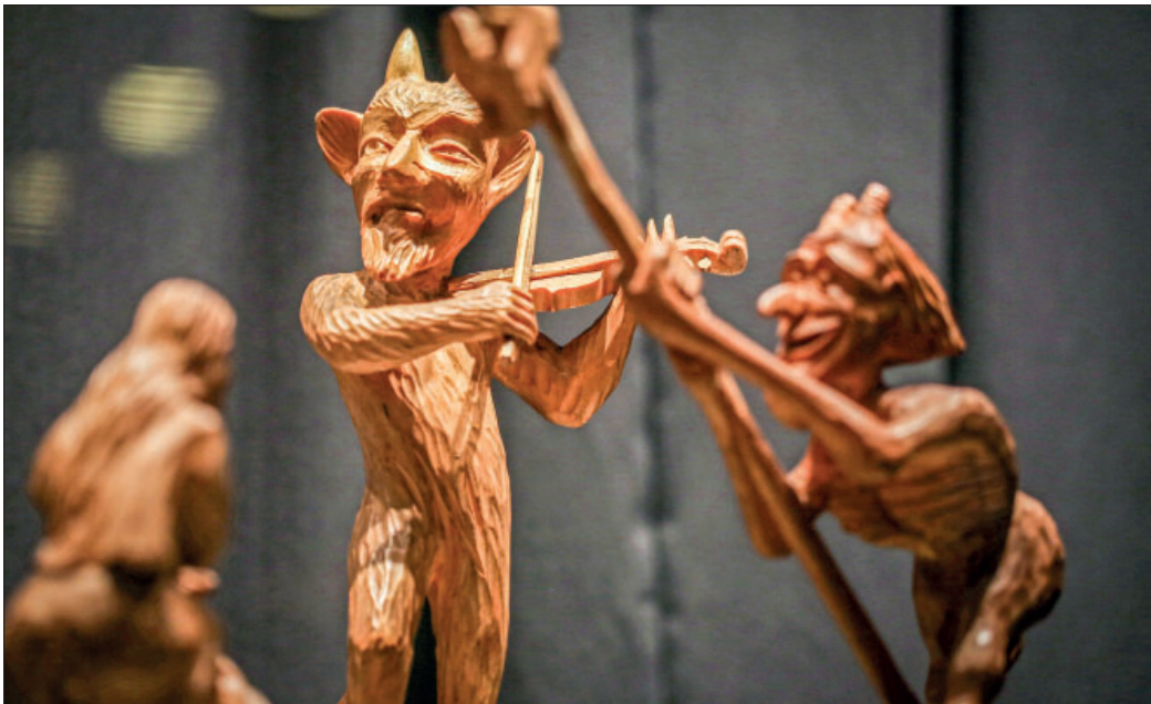
We wšech lětstotkach spytachu ludžo djaboła na wšelakore wašnje zwobraznić, na přikład jako skulpturu z drjewja w muzeju wo djabołach w litawskim měšće Kaunas.

Wótca“. Dalše modlitwy jako džak a próstwa za zbóžnosť wšech zemrětych a ritus pochowania scěhuja.