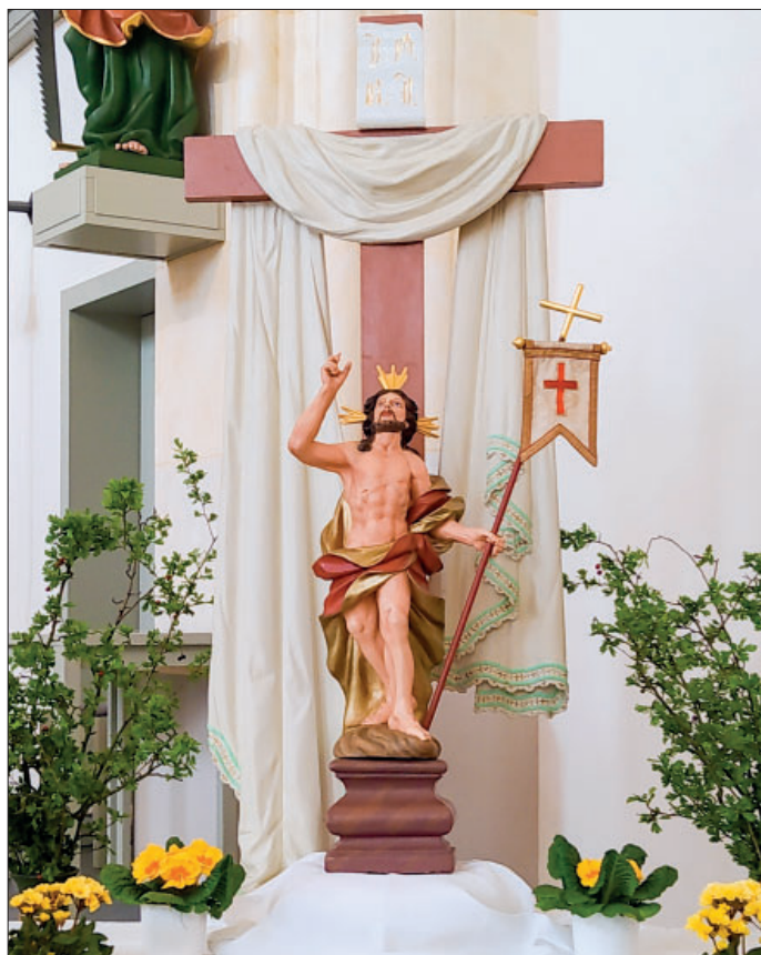
Poselstwo wo Jězusowym zrowastanjenju měło kóždemu čłowjekej woprawdźite swěto być.